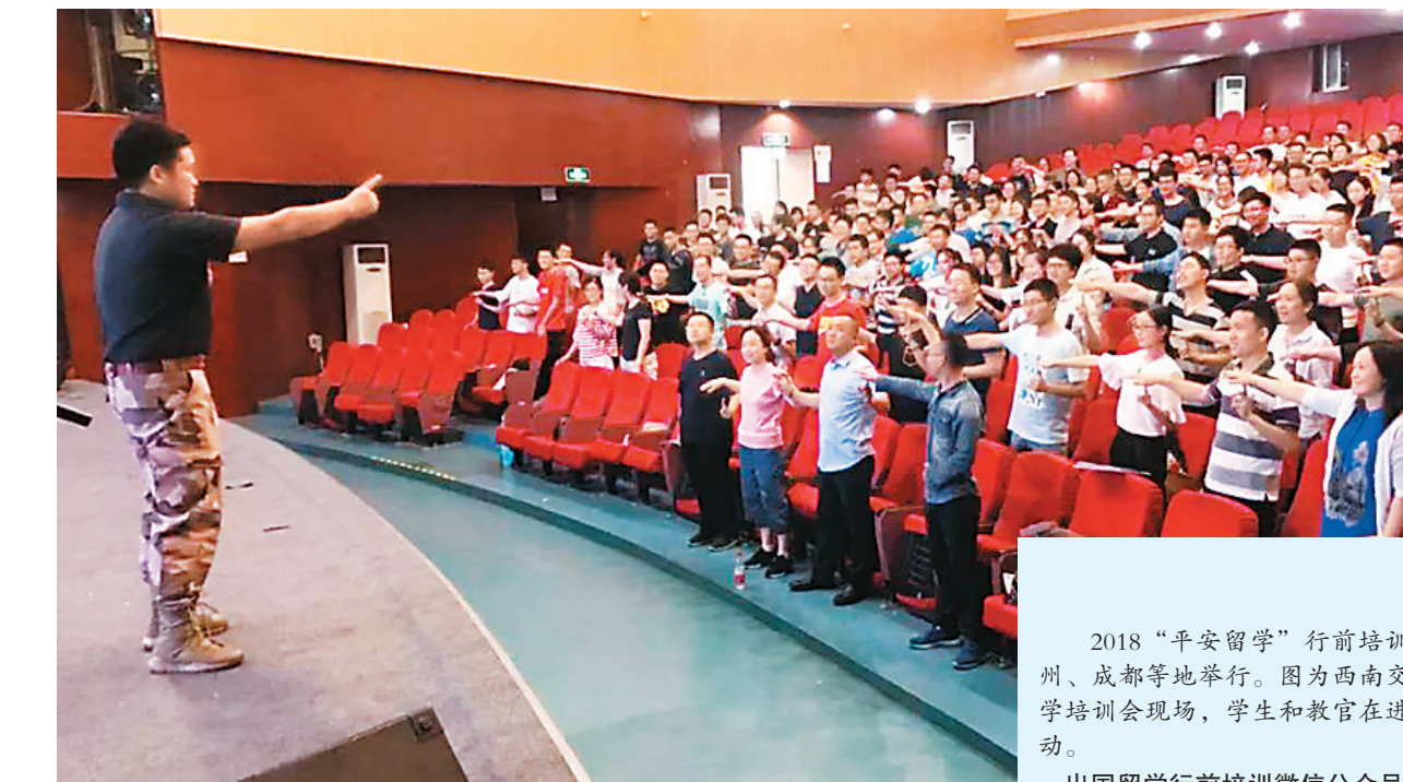
2018“平安留学”行前培训在贵州、成都等地举行。图为西南交通大学培训会现场，学生和教官在进行互动。

“在全球恐怖活动频度和烈度都在增大的背景下，如何评估留学安全？”“如何学习掌握安保技能？”“日常留学生活中，如何规避安全风险？”……日前在京举办的“中国留学生海外安全与心理健康论坛”上，相关领域的专家学者就留学生及家长关注的安全话题，进行了探讨。