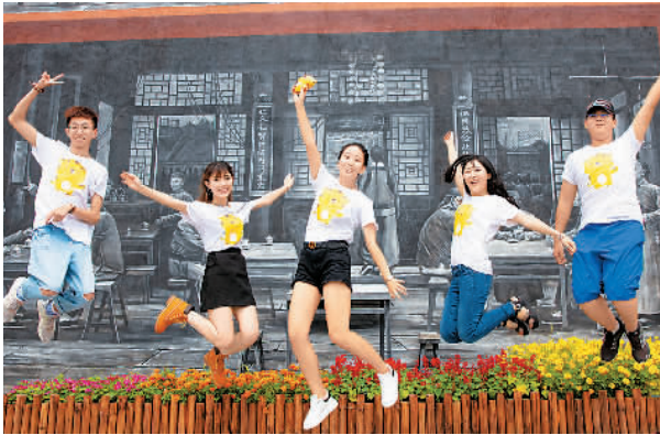
大学生游黑龙江。

夏季黑龙江是年轻人最佳旅游目的地之一。黑龙江作为中国最东最北的省份，有“避暑胜地”和“天然空调”的美称。黑龙江拥有全国最大的连片森林，伊春五营国家森林公园是亚洲面积最大的红松原始林区。黑龙江拥有全国最大的湿地群，湿地景观类型丰富而独特。黑龙江还有全国最大的界江。黑龙江、乌苏里江是中俄两国界江。黑龙江两岸生态原始，顺流而下可以游一江水览两国风情。这些旅游资源本身壮美且极具探索价值，非常适合年轻人前去冒险。