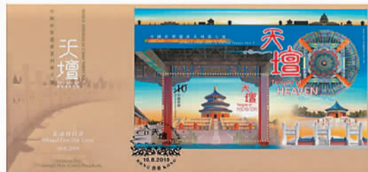
貼有一張郵票小型張的已蓋銷首日封。