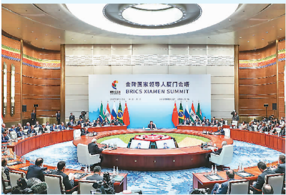
2017年9月4日,金砖国家领导人第九次会晤在厦门国际会议中心举行。国家主席习近平主持会议并发表题为《深化金砖伙伴关系 开辟更加光明未来》的重要讲话。