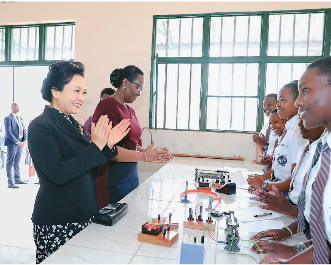
当地时间七月二十三日上午，国家主席习近平夫人彭丽媛在卢旺达总统夫人珍妮特陪同下参观位于基加利北部加萨博区的法维女子中学。

本报基加利7月23日电（记者万字、张炜）当地时间23日上午，国家主席习近平夫人彭丽媛参观位于基加利北部加萨博区的法维女子中学。