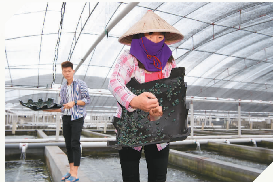
▲ 澳角村一处大型鲍鱼苗养殖场，一位村民在查看鲍鱼苗生长情况。