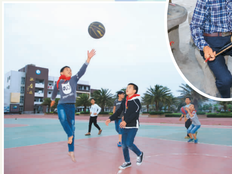
▼ 澳角小学的学生在操场玩篮球。