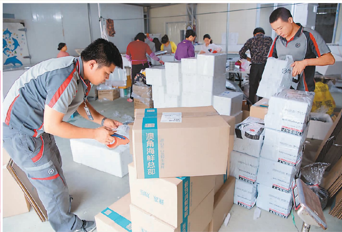
▲ 在澳角村一家海鲜包装车间，两名快递员在打包邮件。现代物流业的发展，让这里的产产品远销海内外。