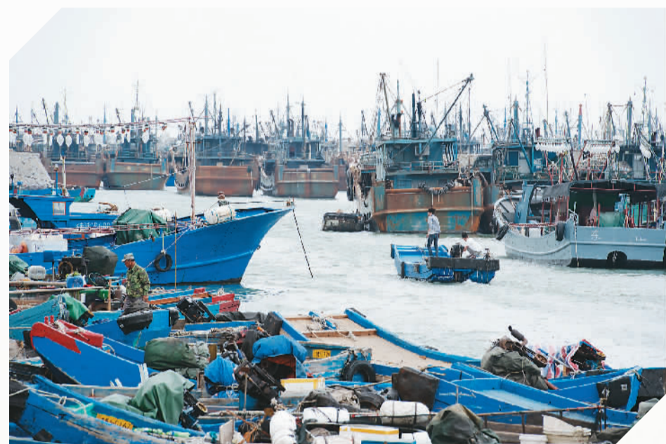
▲ 澳角渔港内，停满了渔船。