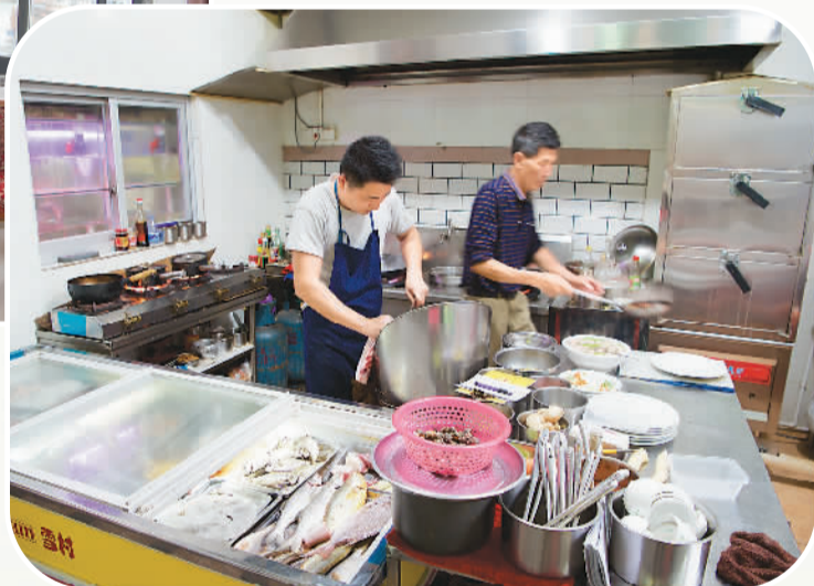
▶ 澳角村一家饭店内，厨师在为顾客制作美食。