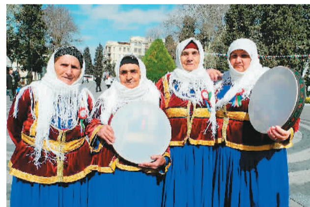
节日里的阿塞拜疆妇女。