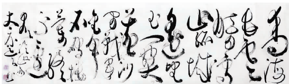
吴东魁书王昌龄《从军行七首·其四》