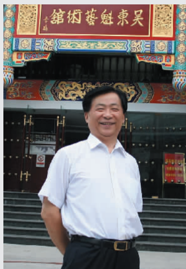
吴东魁,1956年出生于山东菏泽,著名国画家、鉴赏家,国画一级美术师。现任吴东魁艺术馆名誉馆长、华夏画院院长。

出版国画专著《吴东魁画选》《吴东魁国画集》《吴东魁花鸟作品集》等十余部;中央电视台先后为其拍摄《天高任鸟飞》《吴东魁绘画艺术》《吴东魁笔墨技法》等多部专题纪录片。1989年5月在中国美术馆一楼大厅举办个人画展。