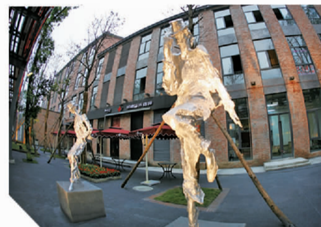
成都东郊记忆文创园区