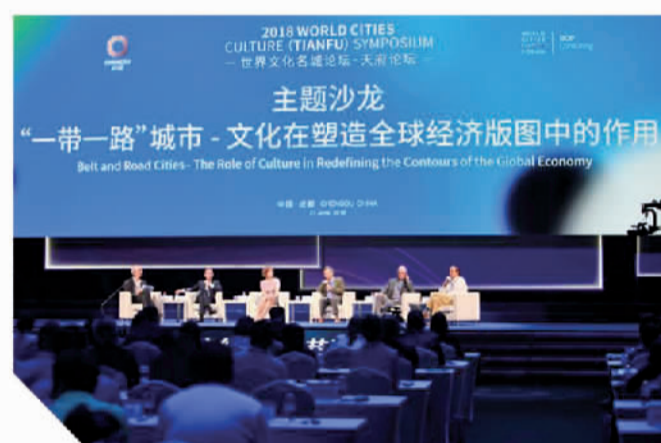
世界文化名城论坛·天府论坛主题沙龙

《总规》还提出，成都将构建系统完善的历史文化遗产保护体系，依托历史文化名城保护，构建三轴、四片、多点的城市景观格局。成都将把天府锦城建设成为体现“老成都、蜀都味、国