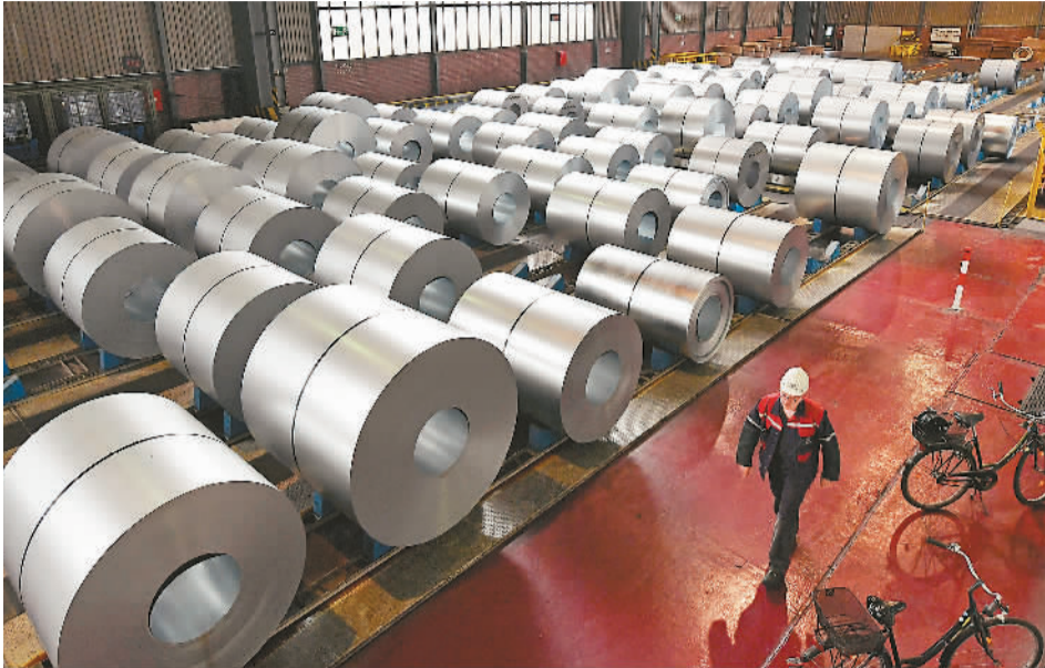
随着美国日前宣布对欧盟等经济体钢铝产品征收高关税，欧盟、墨西哥、加拿大等国纷纷表态将采取报复行动。图为德国杜伊斯堡一家钢铁厂。

撰文批评称，特朗普政府将进攻性贸易政策放在治理国内经济的核心位置是有问题的。大部分经济学家一致认为，这种贸易政策的调整不大可能对就业或GDP增长起到显著的促进作用，反而只会削弱美国的经济竞争力和影响力。