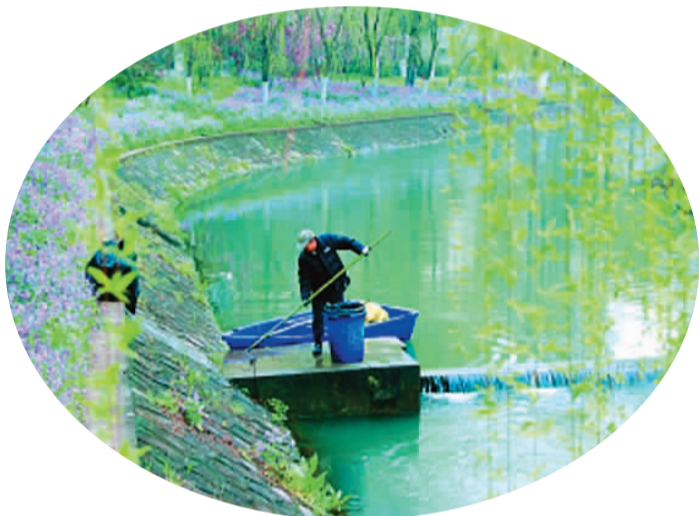
南京专职人员进行河道日常清理。

越来越多的被污染的城市河流，正从曾经的有异味、浑浊的黑臭水体，变为河水清澈、两岸风景优美、市民宜居的“可傍之水”。