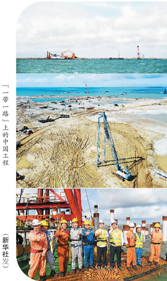
“一带一路”上的中国工程