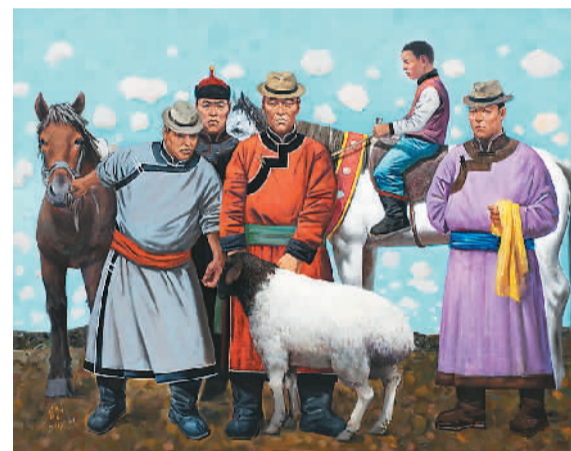
小巴特的奖品 白音吉力根

西部少数民族青年美术家创作高研班以抓创作、出精品为培养原则，学员在学习期间都多次到民族地区体验生活，研究各民族的优秀文化传统。高研班自2011年设立以来，以面向西部少数民族地区从事民族美术创作和美术事业的基层少数民族文化干部或基层青年美术教师公开招生、集中培养的方式，共培养了156名优秀学员。