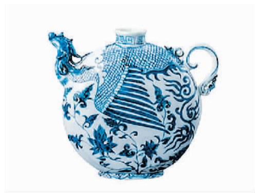
景德镇青花凤首扁壶 首都博物馆藏

为充分反映“丝绸之路”在东西方文化交流中的深远影响，弘扬和传承和而不同、开放包容的丝路精神，中国国家博物馆和湖南省博物馆联合主办的“无问西东——从丝绸之路到文艺复兴”展日前在北京开展。展览汇集了意大利21家博物馆、中国17家博物馆共计200余件(套)文物精品，通过还原意大利文艺复兴中的中国元素以及中国艺术中的西方影响，呈现不同文明之间交流互鉴、兼收并蓄、共同发展的千年史话，揭示多元文化交流共生、相互影响的历史脉络。