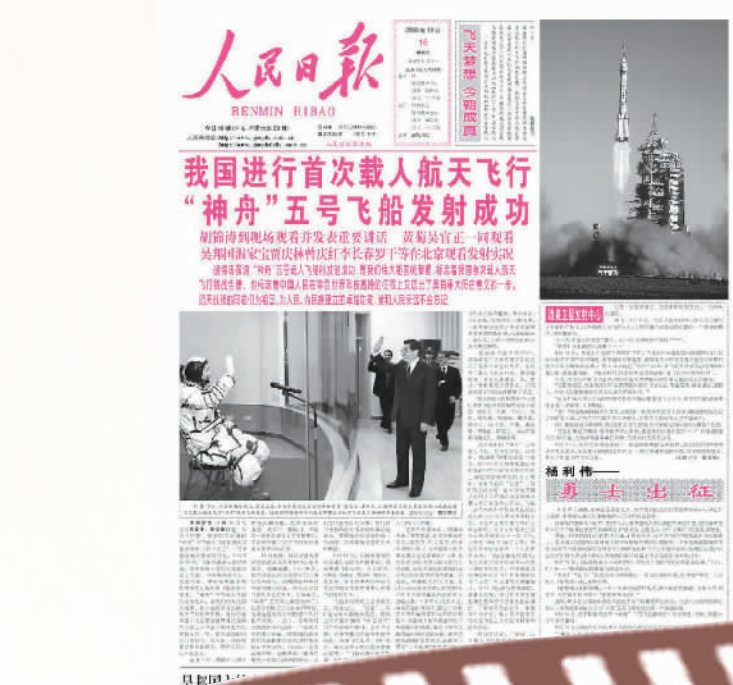
▲2003年10月15日，“神五”发射成功。《人民日报》次日突出报道了这一重大科技成就。