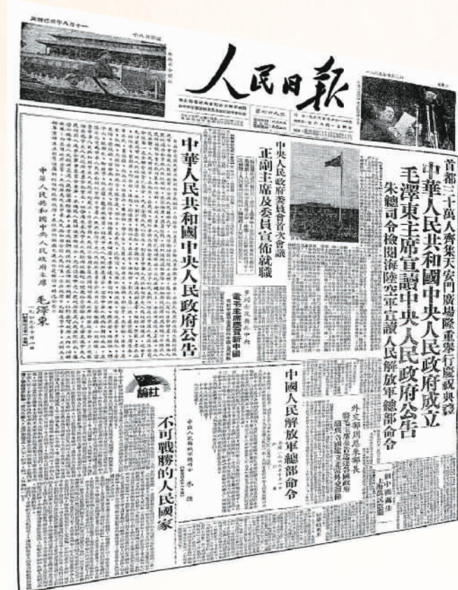
▲1949年10月1日，中华人民共和国中央人民政府成立，首都30万人齐聚天安门广场隆重举行庆祝典礼。图为《人民日报》次日隆重报道开国大典的版面。