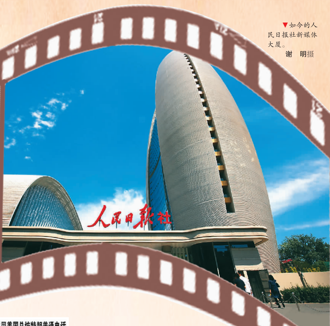
▼如今的人民日报社新媒体大厦。