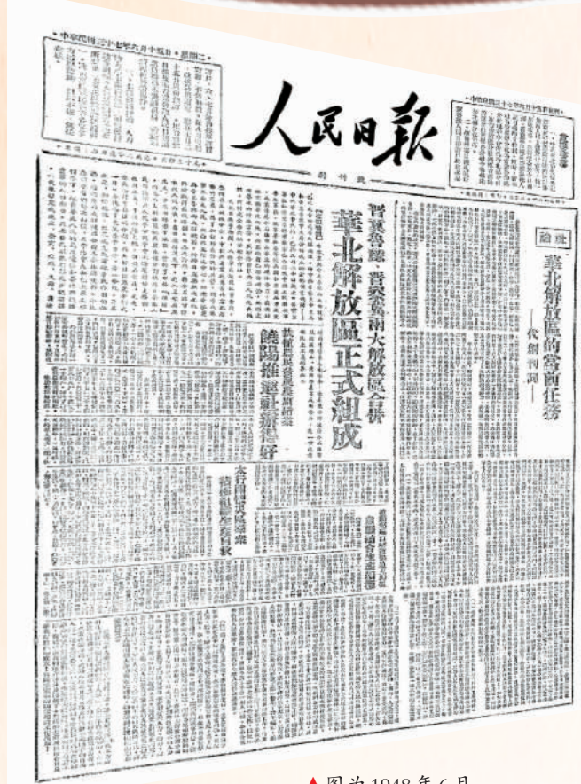
▲图为1948年6月15日《人民日报》的创刊号。