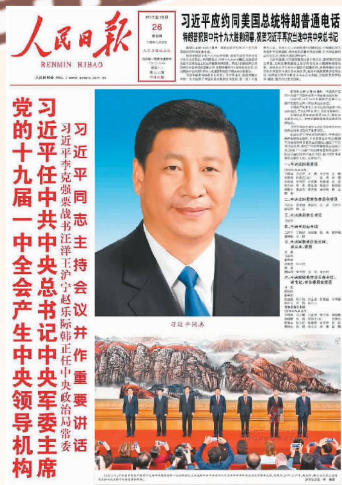
▲2017年10月25日，中共十九届一中全会产生中央领导机构，习近平任中共中央总书记、中央军委主席。次日的《人民日报》头版刊登消息。