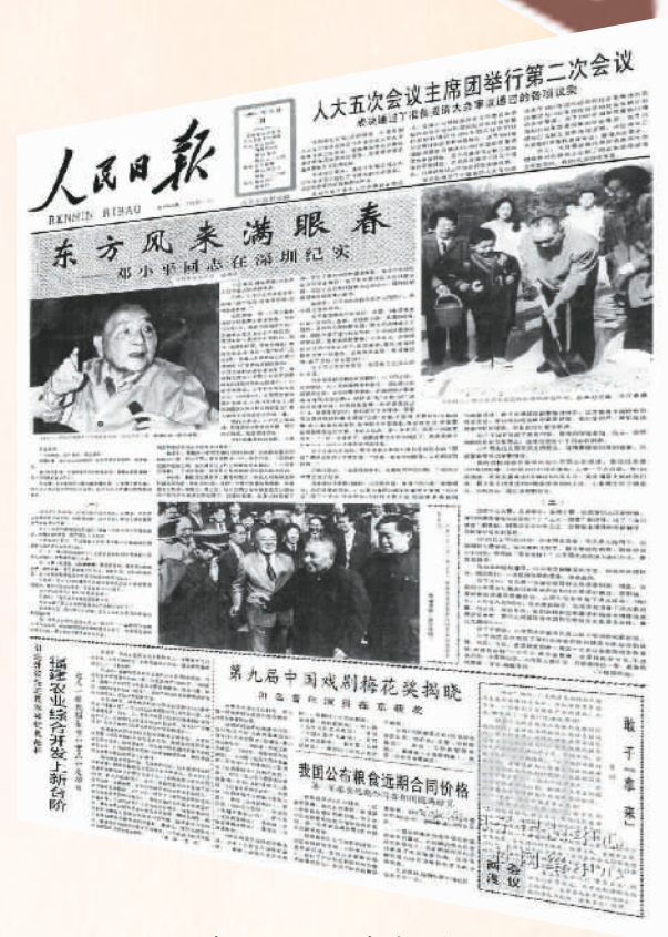
▲1992年3月31日，《人民日报》头版刊登了邓小平同志在深圳纪实。