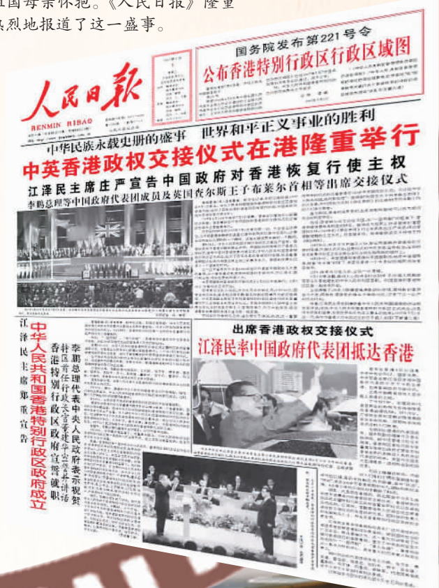
▼1997年7月1日，香港回归祖国母亲怀抱。《人民日报》隆重热烈地报道了这一盛事。