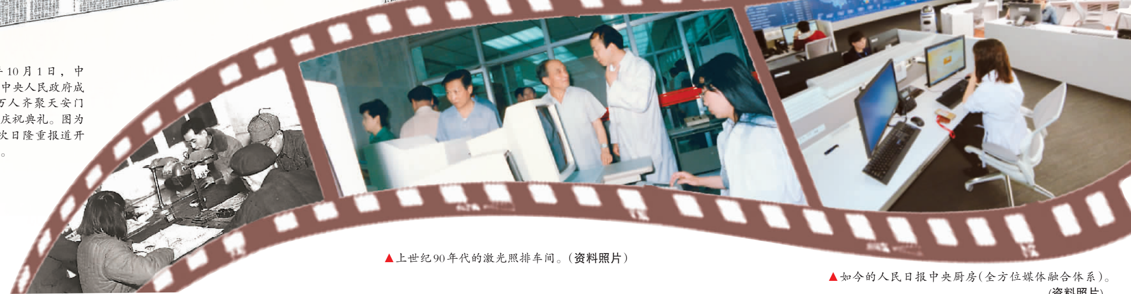
▲上世纪90年代的激光照排车间。（资料照片）