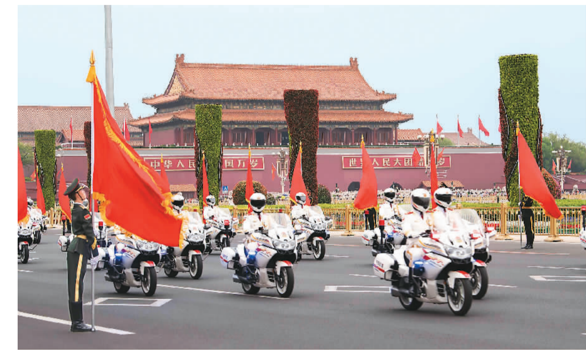
图为6月6日，摩托车护卫队护卫外宾主车至人民大会堂东门外广场东北口。在外宾主车抵达沿途增设80名手持红旗的仪仗兵方阵，进一步提升欢迎氛围。新华社记者 李涛摄

值得一提的是，三军仪仗队中首次增加了女兵方阵。此前仪仗队中的女兵与男兵混合编队，现在女兵人数大幅度增加，陆、海、空军共55名女兵单独编成方阵，位于3个男兵方阵之后压轴出场。仪仗队总人数也扩充为224人。中国人民