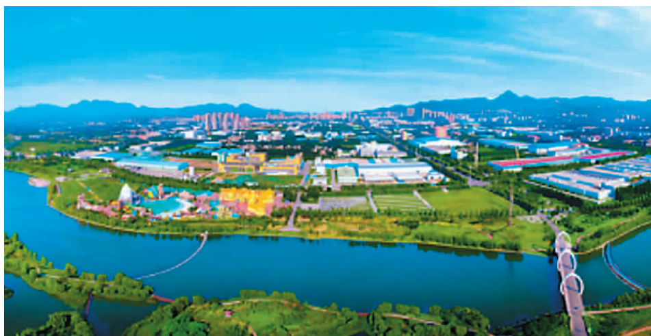
绣源河综合开发区

小时候知道的中国地名不多，譬如北京、上海和唐山，居然还知道章丘。记得经过天津闹市区瑞蚨祥绸缎庄，老辈人说“这是章丘孟家开的……”那时天津是大商埠，当地人对工商业有所了解，我因此而闻知章丘地名。