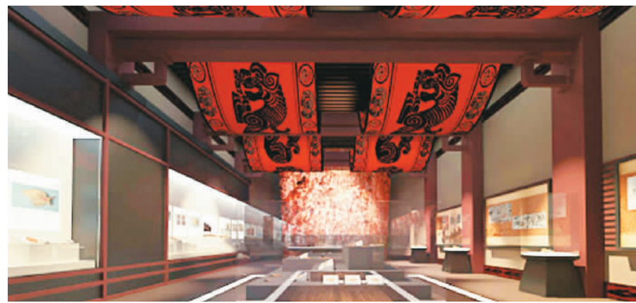
章丘博物馆

从古都西安城南向南驱车20公里，便驶入连绵起伏的青山怀抱。越深入，两旁的树木越发郁郁苍翠，清新的空气沁人心脾。翠华山景区仿佛伸开绿荫妆成的双臂，盛情拥抱每一位前来游玩的客人。