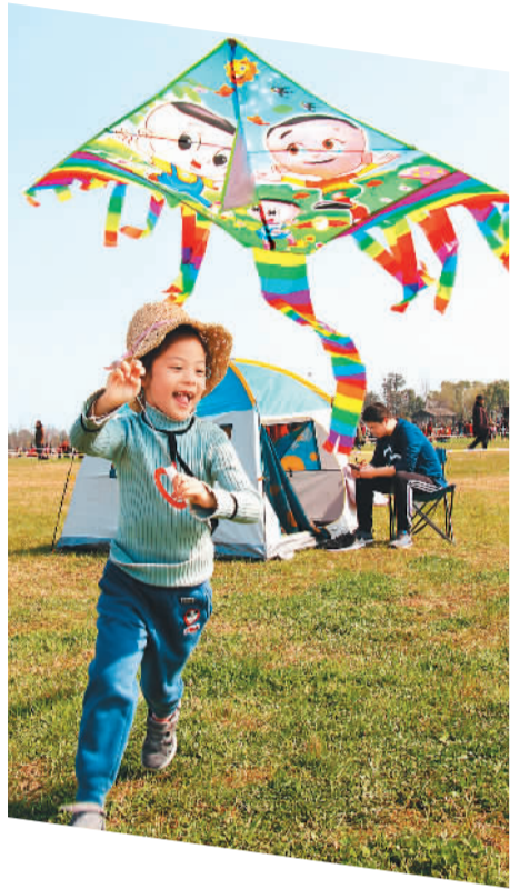
一名小朋友在苏州阳澄湖半岛旅游度假区放风筝。