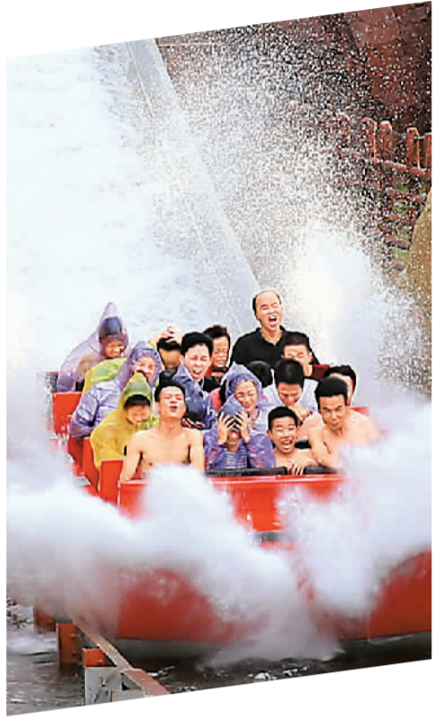
游人在广西柳州市卡乐星球欢乐世界体验峡谷飞舟。