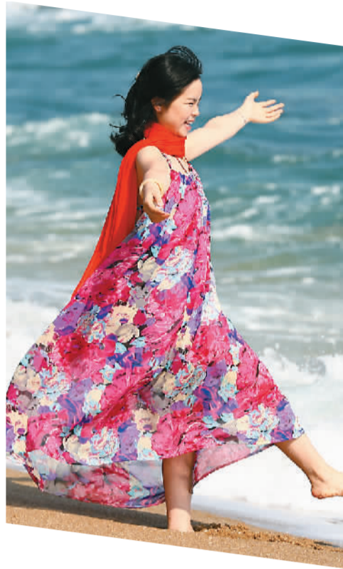
一名游客在海南省三亚市南山景区海边戏水。