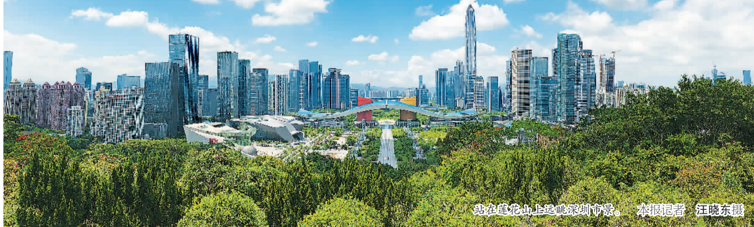
站在莲花山上远眺深圳全景。