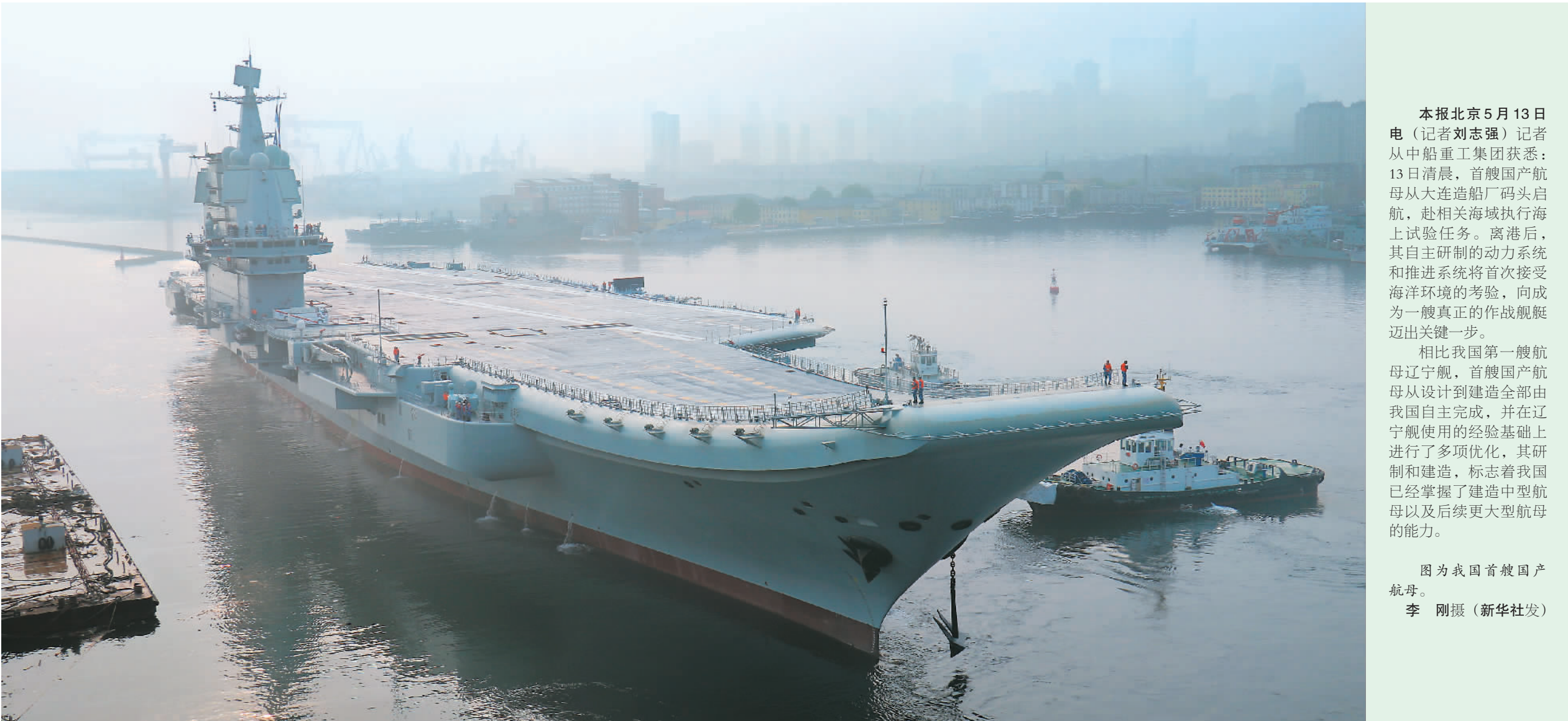
本报北京5月13日电（记者刘志强）记者从中船重工集团获悉：13日清晨，首艘国产航母从大连造船厂码头启航，赴相关海域执行海上试验任务。离港后，其自主研发的动力系统和推进系统将首次接受海洋环境的考验，向成为一艘真正的作战舰艇迈出关键一步。 相比我国第一艘航母辽宁舰，首艘国产航母从设计到建造全部由我国自主完成，并在辽宁舰使用的经验基础上进行了多项优化，其研制和建造，标志着我国已经掌握了建造中型航母以及后续更大型航母的能力。 图为我国首艘国产航母。

店，以及联通远方的高速公路和铁路展现眼前，一派热火朝天的城市建设景象。 这是美国《大西洋》月刊记者在瓜达尔港的所见。这种改变正源于“一带一路”建设。作为中巴“一带一路”合作的标志性项目，瓜达尔港自中国企业负责建设和运营以来发展提速，点亮了当地人的梦想。 巴基斯坦内政部长阿赫桑·伊克巴尔近日接受新华社记者采访时说：“‘一带一路’倡议推动下的中巴经贸合作，为数百万巴基斯坦人民生活带来积极变化。” 伟大的事业需要伟大的实践。从发展友好合作到达成务实协定，从加大建设资金支持到加强创新合作，习近平主席在主旨演讲中提出的一系列务实举措向世界宣示，中国是共建“一带一路”的倡议者，更是负责任、有担当的实践者。 一年来，从由中企承建的肯尼亚蒙内铁路正式通车，到中俄亚马尔液化天然气项目首条生产线投产；从“冰上丝绸之路”“数字丝绸之路”，到中老经济走廊、中缅经济走廊……“一带一路”建设国际合作正掀起新热潮。 正如美国《福布斯》杂志所观察到的，“在世界各地的政府与企业会议室里，在物流枢纽现场，在数十个国家的新建经济特区，‘一带一路’建设正实实在在地发生着”。 “一带一路”建设正一步一个脚印推进实施，一点一滴积累成果。“一带一路”承载着各国发展与繁荣的梦想，通向更加美好的未来。 （新华社北京5月13日电 记者杜静）