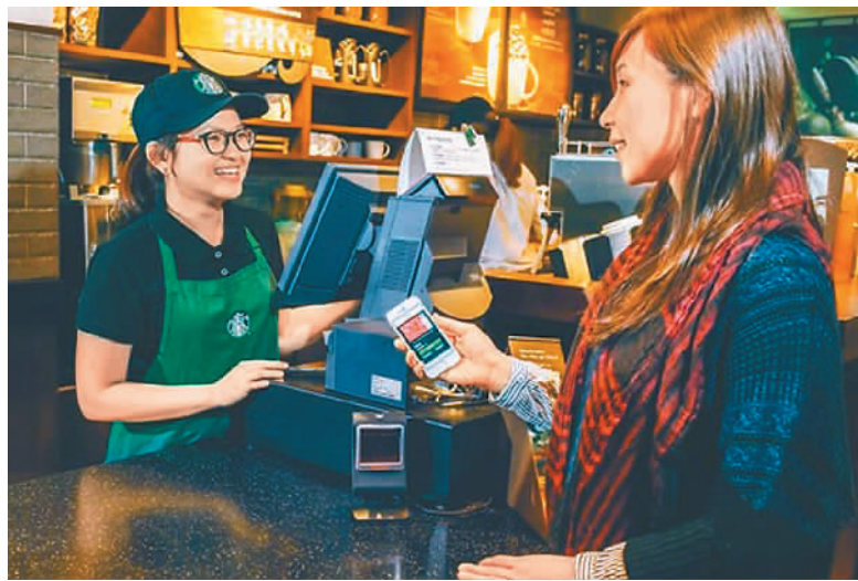
台湾消费者使用手机支付。

由于一开始就落后大陆等岛外社会,当局有关部门看在眼里急在心里,相关政策支持一下子就多起来。比如“金管会”宣布自4月中下旬起,开放民众可以用街口支付等电子支付账户,购买岛内货币型基金,出招打造“台版余额宝”。