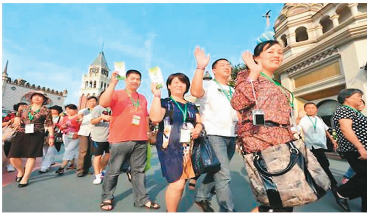
中国游客出境游。来自网络

2017年，自由行服务平台马蜂窝旅行网宣布成立AI事业部，深度开发马蜂窝大数据平台，剖析用户特征与兴趣偏好，打造全球首款超智能旅行机器人“蚂蜂1号”，利用科技将旅游大数据更高效地应用到旅行场景中，为用户提供个性化旅行体验，例如为