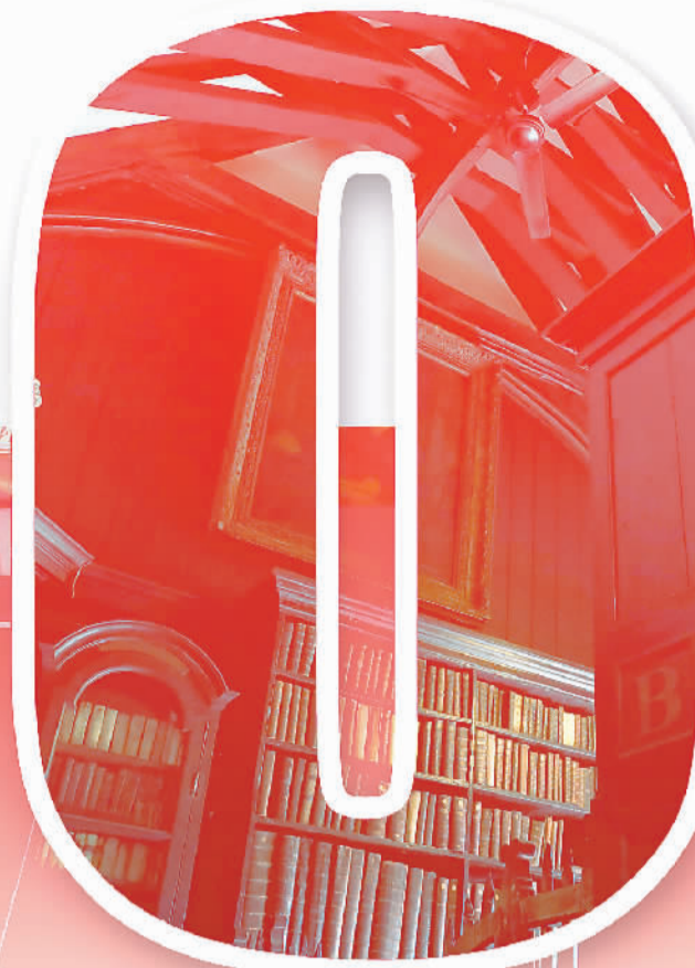
照片说明： 左图为《共产党宣言》现存于世的唯一一页手稿。 新华社记者 叶平凡摄 中图为比利时布鲁塞尔让·达登街50号，是马克思创作完成《共产党宣言》的地方。 新华社记者 叶平凡摄 右图为英国曼彻斯特切塔姆图书馆。马克思和恩格斯曾在此多次会面，查阅大量资料。 新华社记者 韩岩摄