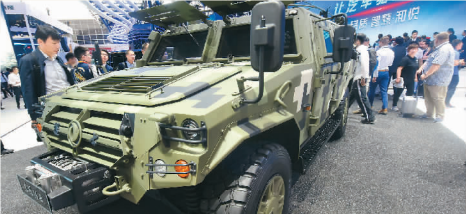
4月25日，拥有自主知识产权的军用版东风猛士亮相北京车展。

的组合效应，更好地支撑创新驱动发展和扩大对外开放。 针对科技型中小企业固定资产少、融资难等突出问题，中国大力推进知识产权质押融资工作，引导众多初创企业依靠知