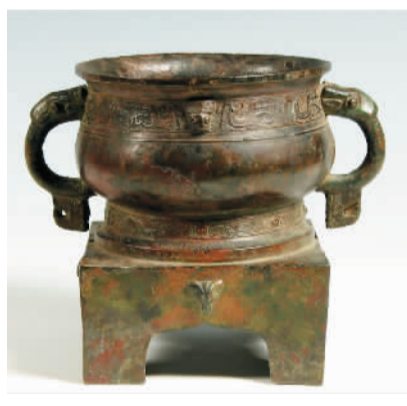
西周过伯簋 (gu i)