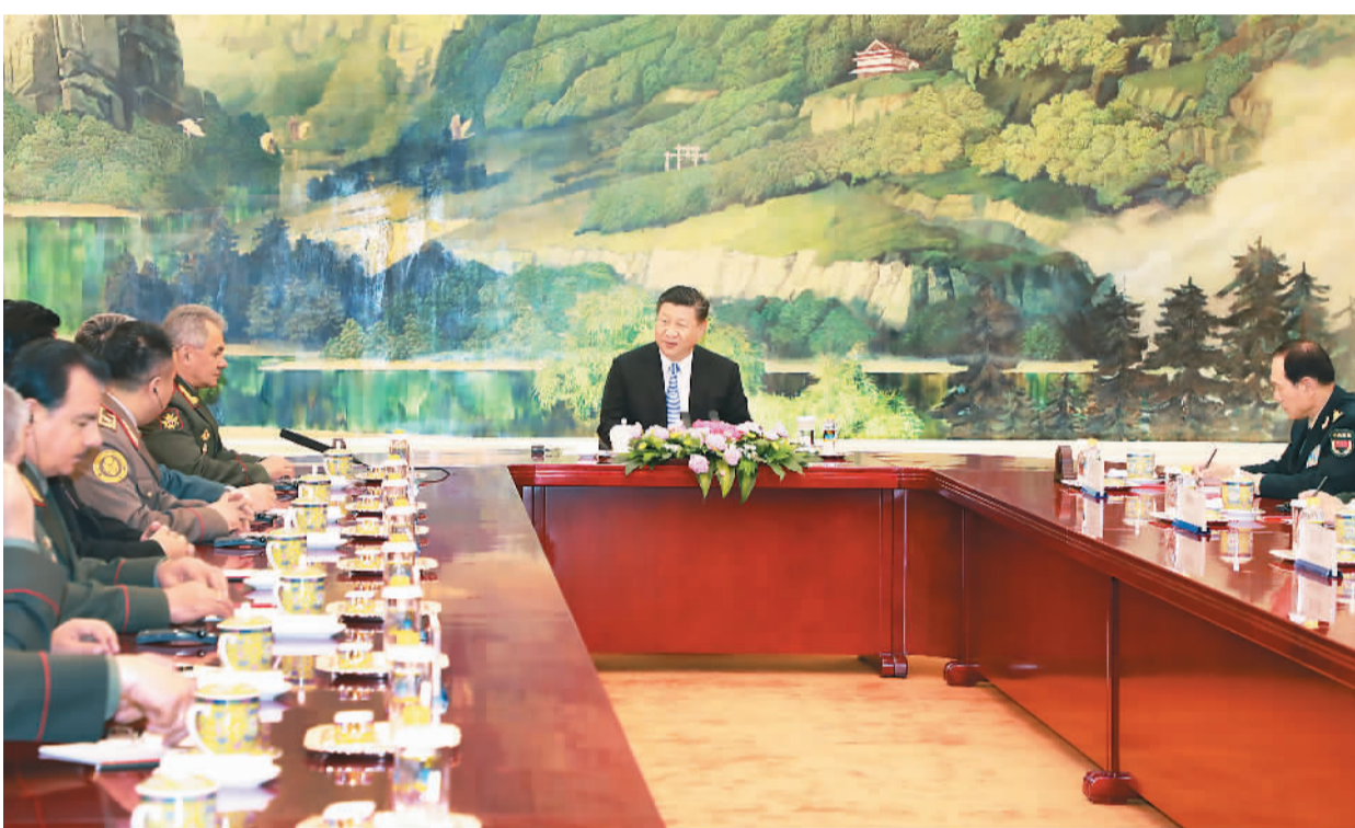
4月23日，国家主席习近平在北京人民大会堂集体会见上海合作组织成员国国防部长。

新华社北京4月23日电（记者白洁）国家主席习近平23日在人民大会堂集体会见来华出席上海合作组织成员国外长理事会会议的俄罗斯外长拉夫罗夫、印度外长斯瓦拉杰、哈萨克斯坦外长阿布德拉赫曼诺夫、吉尔吉斯斯坦外长阿布德尔达耶夫、巴基斯坦外长阿西夫、塔吉克斯坦外长阿斯洛夫、乌兹别克斯坦外长卡米洛夫、上海合作组织秘书长阿利莫夫、上海合作组织地区反恐机构执委会主任瑟索耶夫。