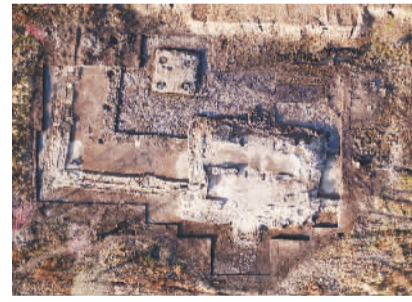
JZ1、回廊西南转角、与亭式建筑JZ6(上北下南)