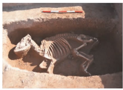
朱仓M722陵园遗址祭祀坑牛骨(由西向东)