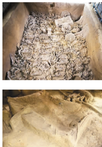
上图为国三号车马坑全景 下图为国三号车马坑一号大型安车