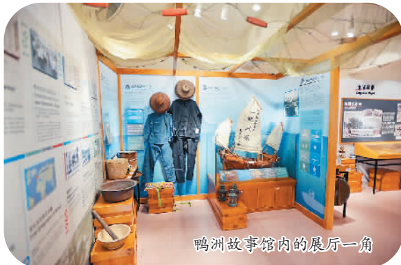
鸭洲故事馆内的展厅一角

筹备两年，鸭洲故事馆日前揭幕。香港环境局局长黄锦星及渔护署署长梁肇辉都有出席，200多名移居英国的村民也专程回乡参与盛事。