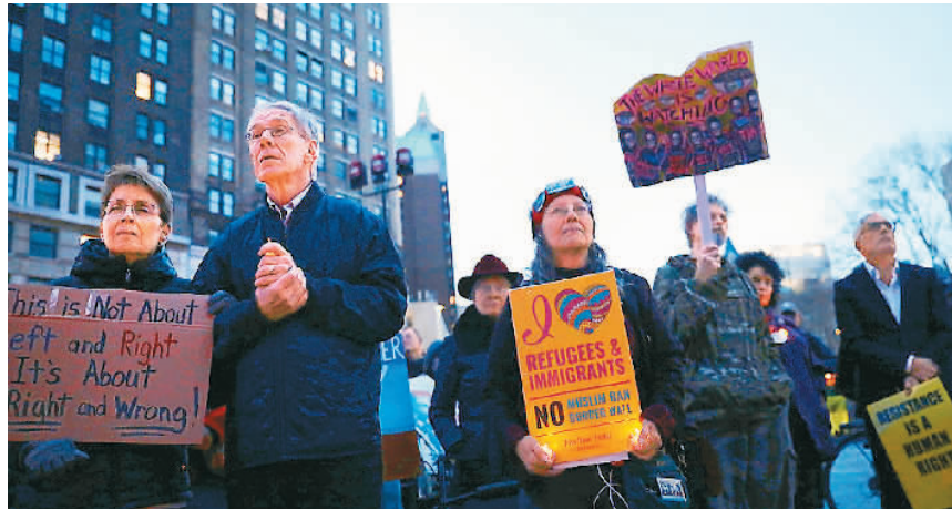
图为纽约民众抗议总统特朗普的移民政策

美国国浩律师事务所张凌云律师也认为，特朗普更愿将工作机会留给本土人。美国更欢迎去投资的移民，而不是抢占社