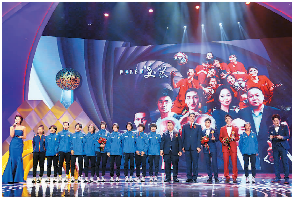
图为颁奖典礼现场