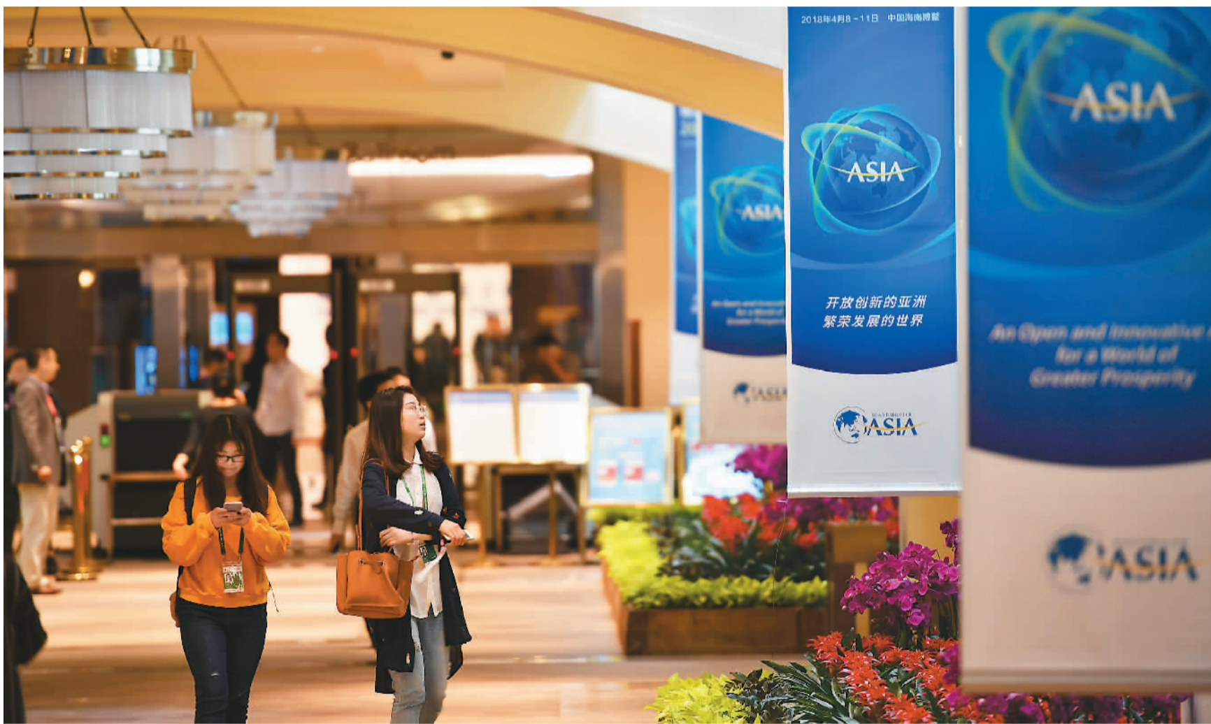
图为通往博鳌亚洲论坛分会场的通道。