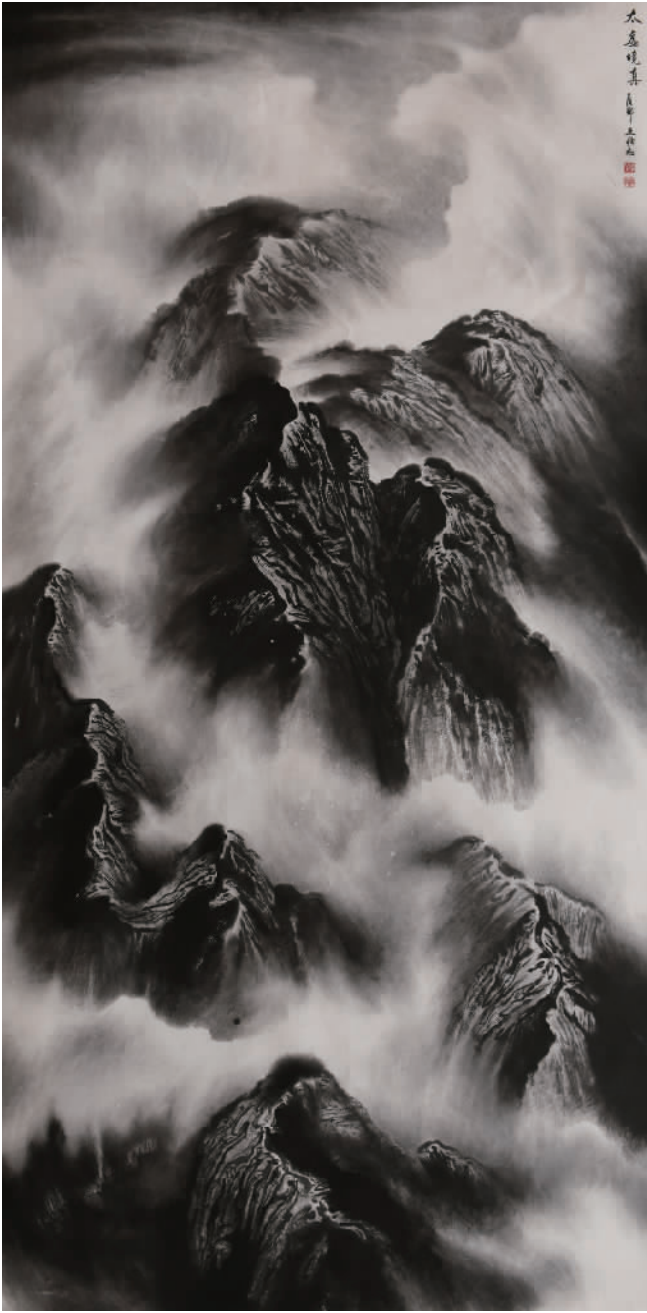
《太虚境真》240cm x 120cm