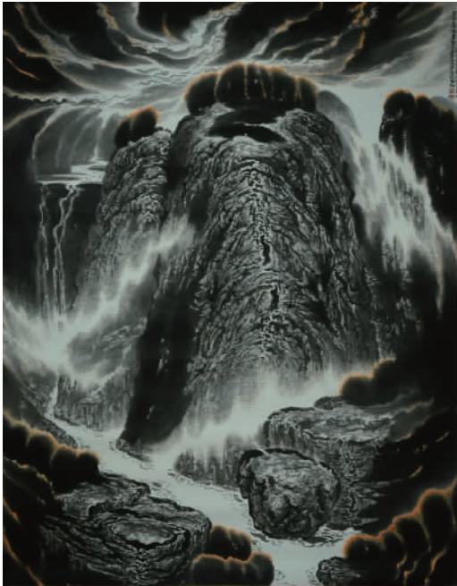
《仁智之乐》240cm x 200cm