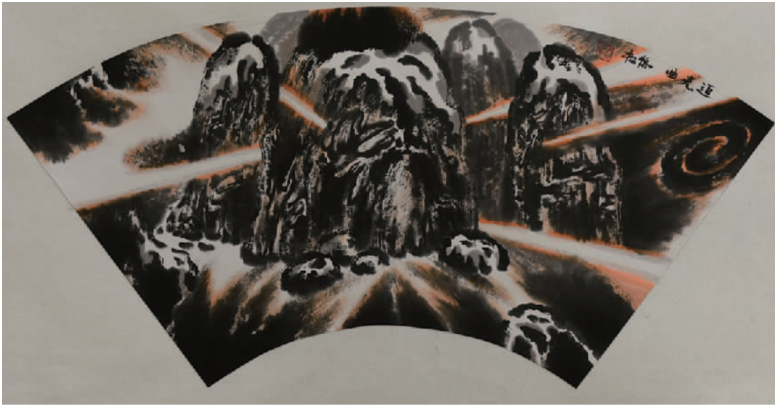
《追光曲》34cm x 68cm 扇面