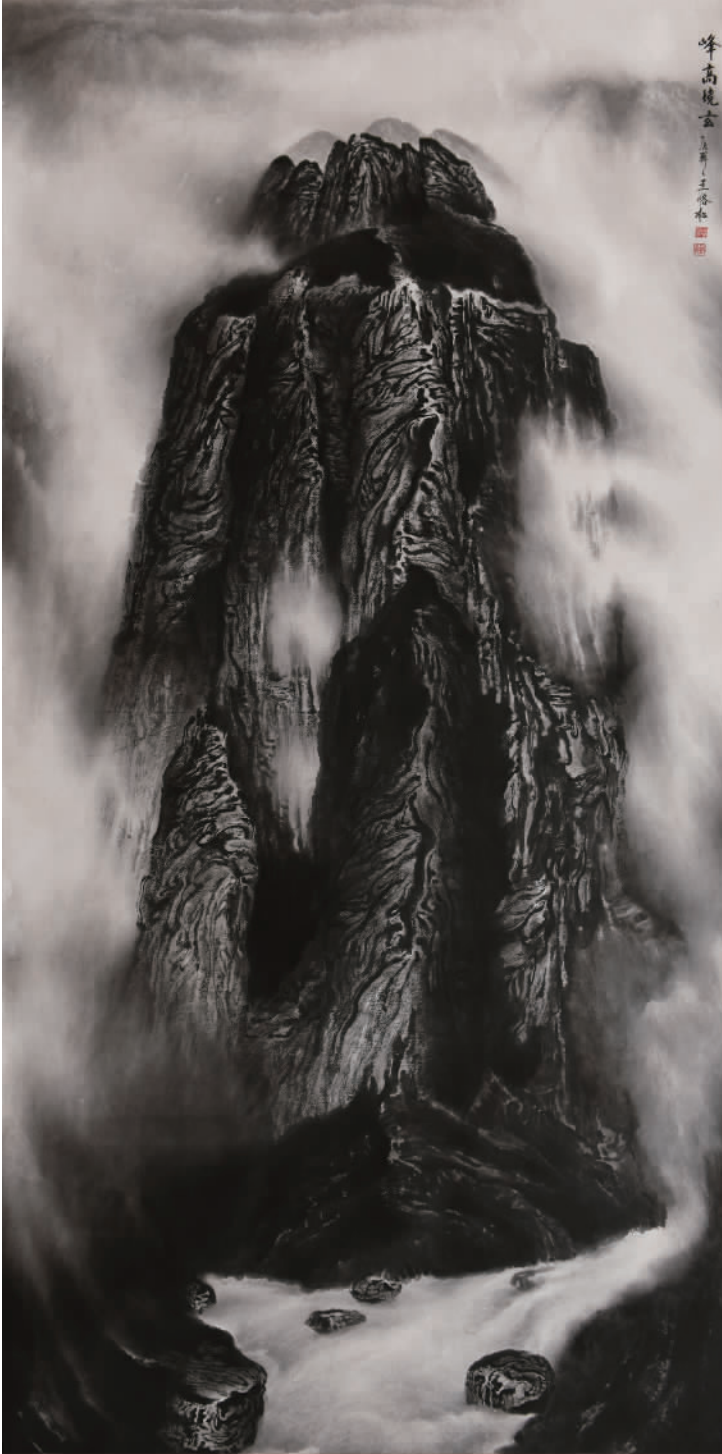
《峰高境玄》240cm x 120cm