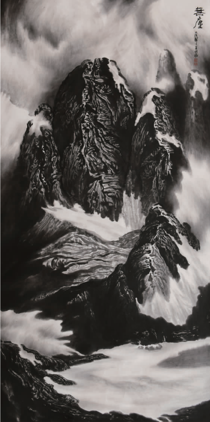
《无尘》240cm x 120cm