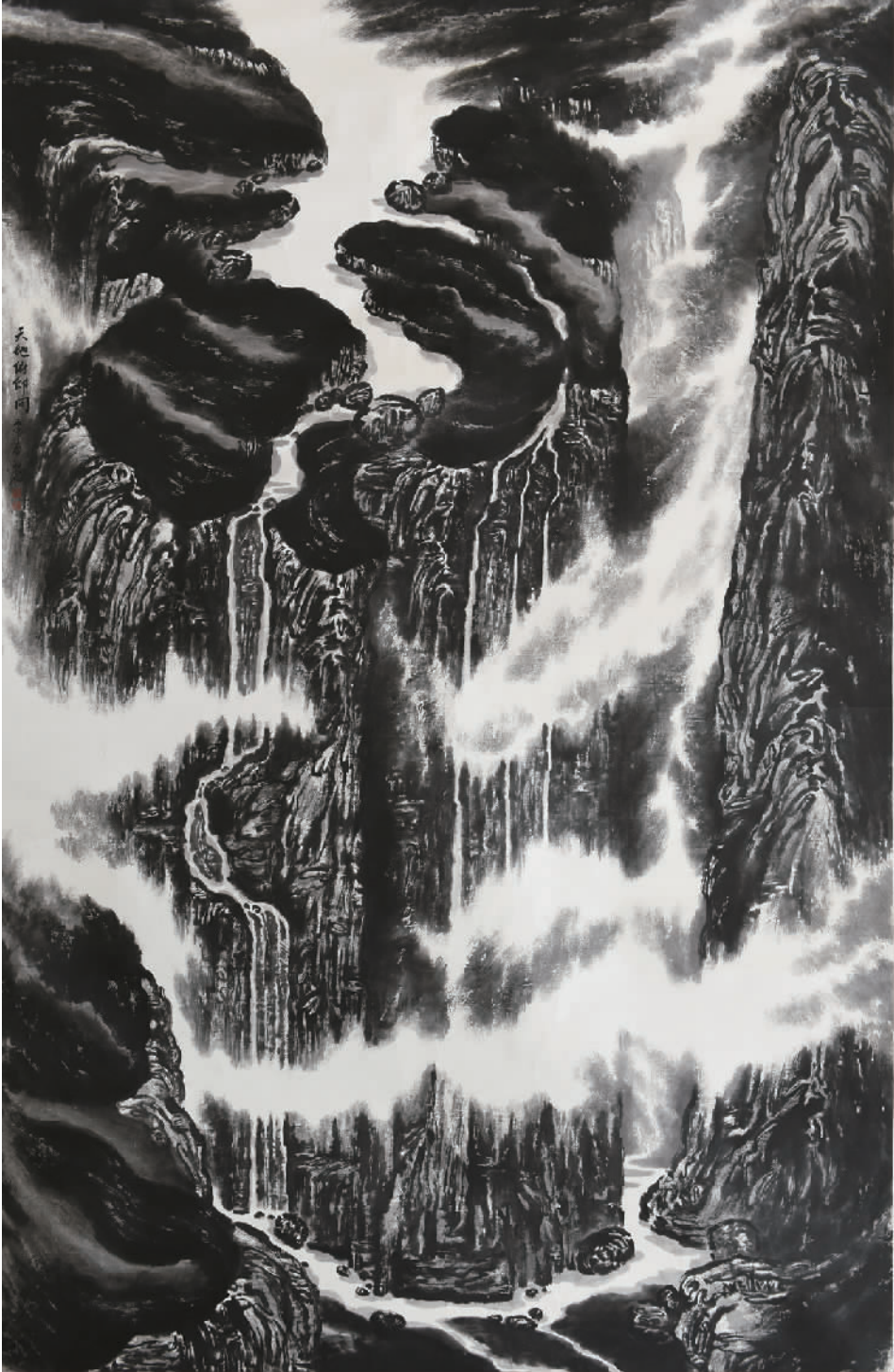
《天地俯仰间》335cm x 215cm