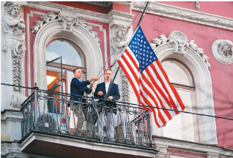
3月31日，在俄罗斯圣彼得堡，美国驻圣彼得堡总领馆的工作人员将美国国旗降下。