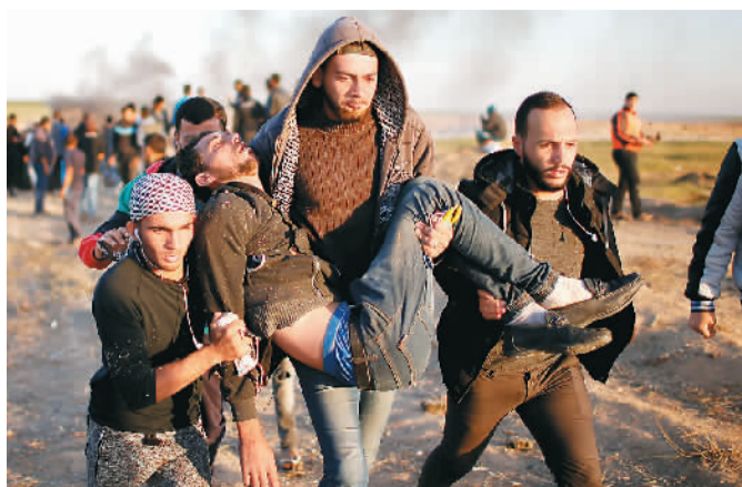
4月1日，在加沙地带边境地区，一名受伤的巴勒斯坦示威者被带离冲突区域。

近期来看，本次冲突起于巴勒斯坦发起“土地日”游行，抗议以方拒绝让巴勒斯坦难民回到被侵占的故