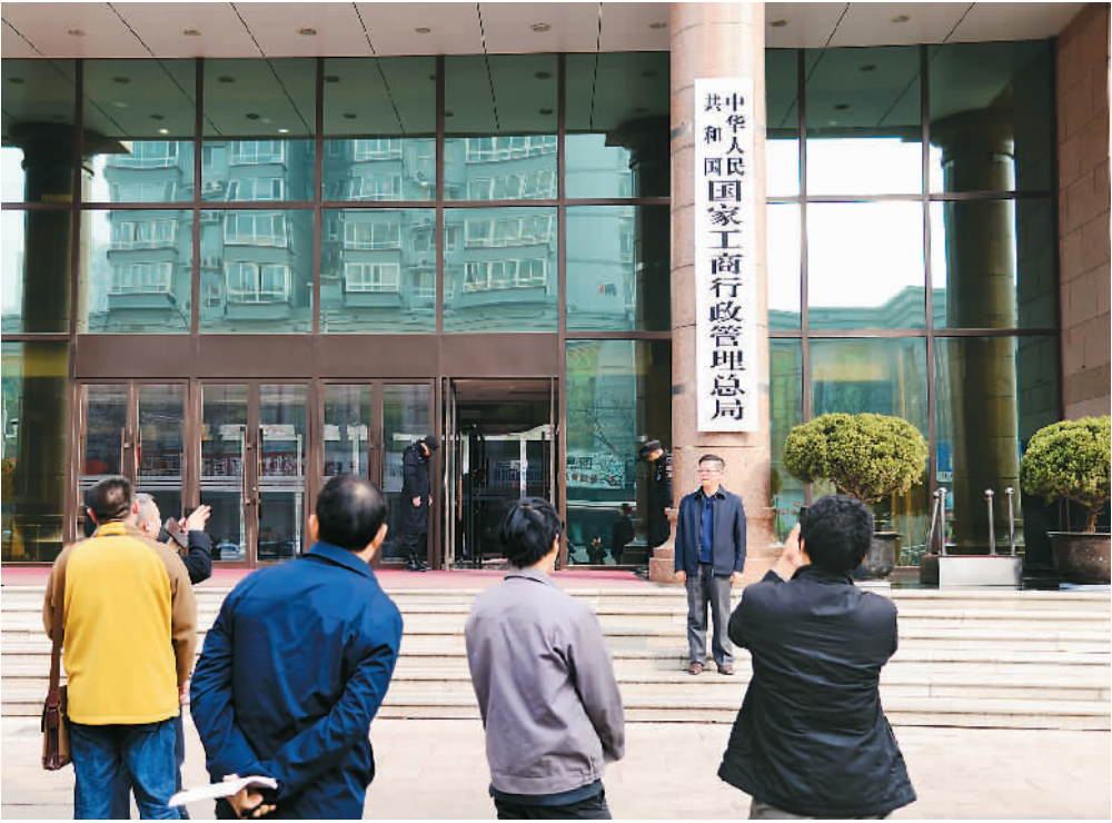
留念。三月十三日，北京市民在国家工商管理总局门前拍照 樊甲山摄（人民视觉）

制图：彭训文 数据来源：中国机构编制网（注：2003年至2018年数据未计入国务院办公厅）