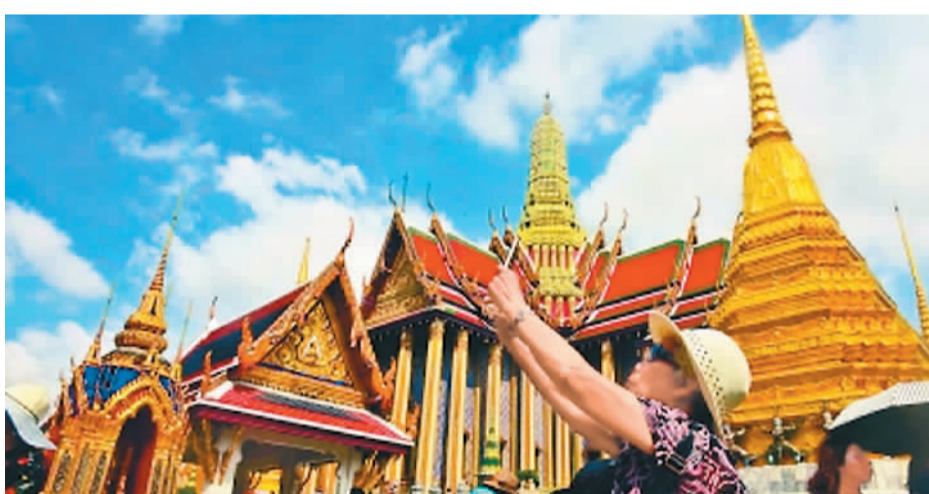
游客游览泰国

图为大连连海游艇帆船俱乐部携“玫瑰云”号再次扬帆起航。这只由大连金石滩国家旅游度假区、香港爱家集团和汉元文化共同助力的船队在场地赛中，两轮成绩均为小组第一，获得IRC2组冠军。