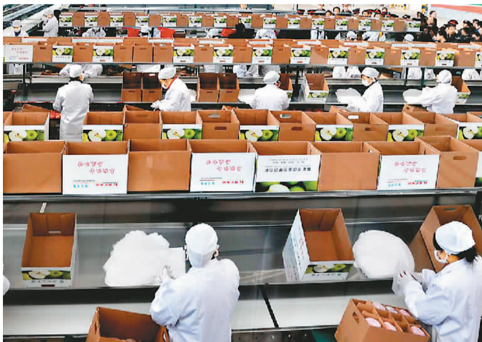
高标准的现代化生态果蔬中心

作为中华文明精神标识的黄帝陵就坐落在黄陵县境内。2018年清明公祭轩辕黄帝典礼将在陕西省黄陵县举行。万余名海内外中华儿女将齐聚黄帝陵轩辕殿祭祀广场，共同祭奠人文始祖轩辕黄帝。黄帝陵已成为跨越历史时空、维系民族情感、振奋民族精神的一大纽带。