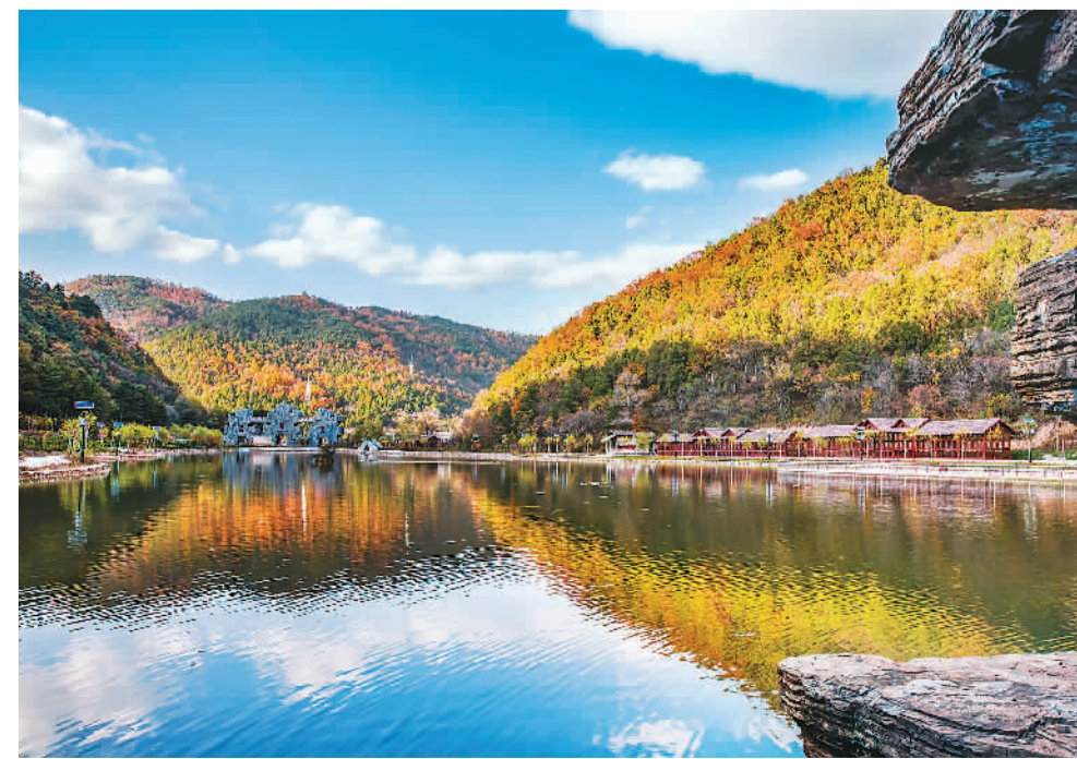
黄陵国家森林公园养生谷景区

实施乡村振兴战略。坚持把实施乡村振兴战略作为建设现代化经济体系的重要基础，作为推进脱贫攻坚的姊妹篇，按照产业兴旺、生态宜居、乡风文明、治理有效、生活富裕的总要求，建立健全体制机制和政策体系，促进农村一二三产业融合发展。加强农村生产生活基础设施和公共服务体系建设，大力推进厕所革命、农业面源污染治理、农村人居环境整治、民居改造等工作，创建美丽乡村示范村12个、生态乡村59个。落实承包地“三权”分置制度和第二轮土地承包到期后再延长30年的政策，推进土地有序流转，多形式壮大集体经济，多渠道增加农民收入。