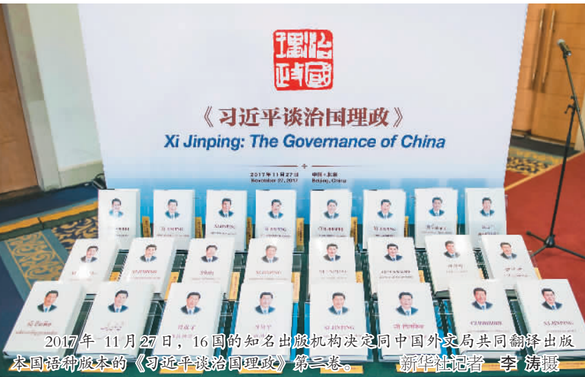
2017年11月27日，16国的知名出版机构决定同中国外文局共同翻译出版本国语种版本的《习近平谈治国理政》第二卷。