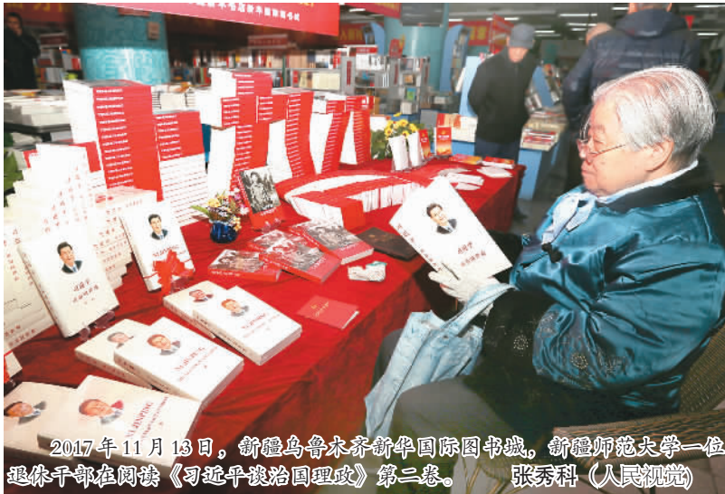
2017年11月13日，新疆乌鲁木齐新华国际书城，新疆师范大学一位退休干部在阅读《习近平谈治国理政》第二卷。