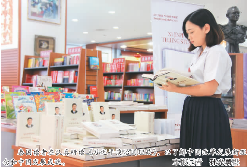
泰国读者在认真研读《习近平谈治国理政》，以了解中国改革发展新理念和中国发展成就。

2017年10月24日，中共十九大通过了关于《中国共产党章程（修正案）》的决议，习近平新时代中国特色社会主义思想写入党章。