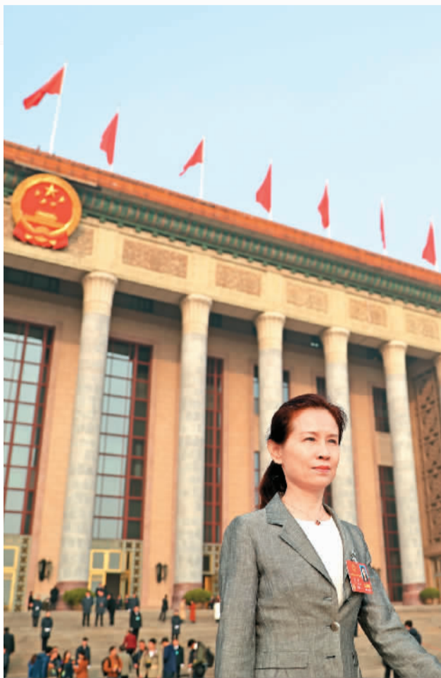
图① 全国人大代表李路在北京人民大会堂前。

今年新修订的政协章程新设立了“委员”一章，对委员履职尽责等提出了明确要求。对于所有从北京两会会场回到各自工作岗位的代表委员来说，履职尽责，是他们未来5年共同面临的重要任务。