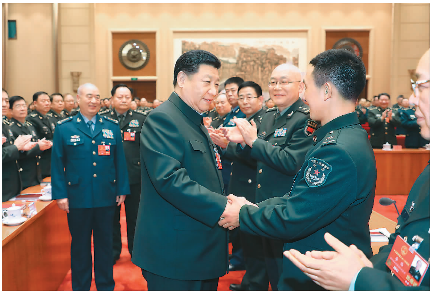
3月12日上午,中共中央总书记、国家主席、中央军委主席习近平出席十三届全国人大一次会议解放军和武警部队代表团全体会议。图为会议开始前,习近平亲切接见与会代表。

习近平就实施军民融合发展战略,加快国防和军队建设提出要求。他强调,要加快国防科技创新,加快建设军民融合创新体系,大力提高国防科技自主创新能力,加大先进科技成果转化运用力度,推动我军建设向质量效能型和科技密集型转变。要密切关注世界军事科技和武器装备发展动向,突出抓好重点领域军民科技协同创新,推动重大项目一体论证和实施,努力抢占科技创新战略制高点。要强化开放共享观念,坚决打破封闭垄断,加强科技创新资源优化配置,挖掘全社会科技创新潜力,形成国防科