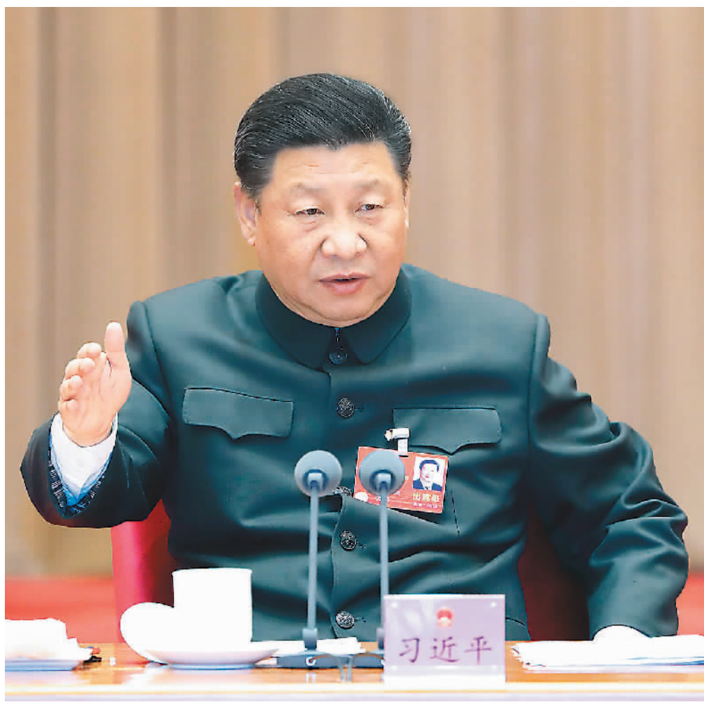
3月12日上午,中共中央总书记、国家主席、中央军委主席习近平出席十三届全国人大一次会议解放军和武警部队代表团全体会议并发表重要讲话。

新华社北京3月12日电(记者李宜良、梅世雄)中共中央总书记、国家主席、中央军委主席习近平12日上午在出席十三届全国人大一次会议解放军和武警部队代表团全体会议时强调,实施军民融合发展战略是构建一体化国家战略体系和能力的必然选择,也是实现党在新时代的强军目标的必然选择,要加强战略引领,加强改革创新,加强军地协同,加强任务落实,努力开创新时代军民融合深度发展新局面,为实现中国梦强军梦提供强大动力和战略支撑。