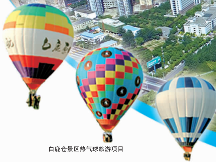
白鹿原景区热气球旅游项目