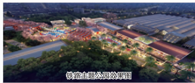
铁路主题公园效果图