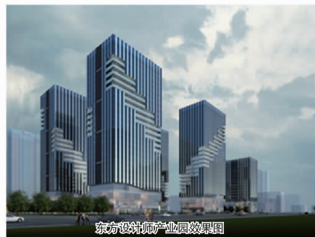
东方设计师产业园效果图