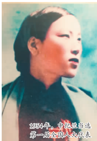
1954年，申纪兰当选第一届全国人大代表

(题图：山西省长治市平顺县西沟村李顺达纪念馆中，习近平同志为太行精神和申纪兰精神题词的展板内容。)