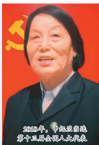
2018年，申纪兰当选第十三届全国人大代表