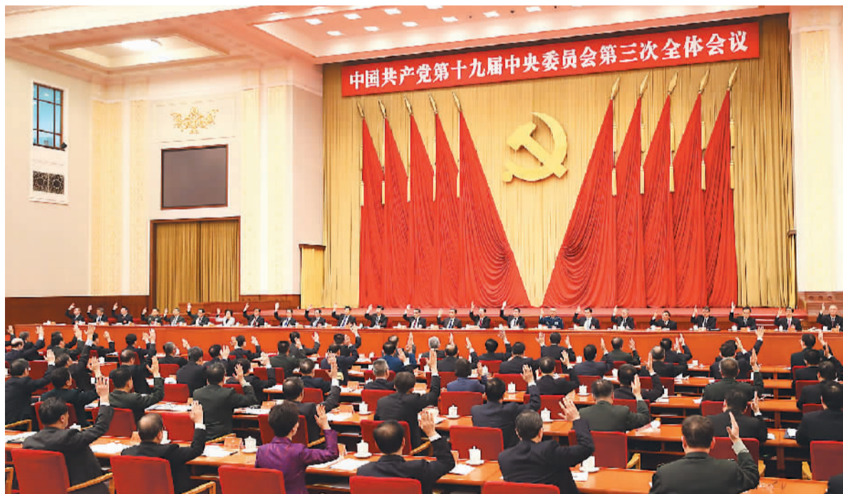
中国共产党第十九届中央委员会第三次全体会议,于2018年2月26日至28日在北京举行。中央政治局主持会议。

持问题导向,突出重点领域,深化党和国家机构改革,在一些重要领域和关键环节取得重大进展,为党和国家事业取得历史性成就、发生历史性变革提供了有力保障。