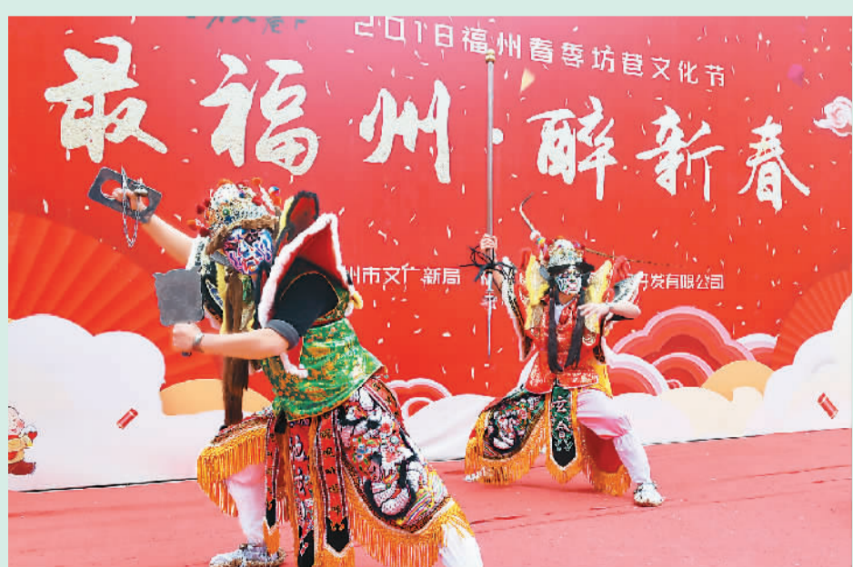
中国历史文化名街——福州三坊七巷近日举行2018闽台春节“正月初五迎财神”传统民俗表演活动。

“我们希望未来一年能给它找个好女婿，或者冷冻精液，这需要与大陆方面展开相关讨论。”王怡敏说。