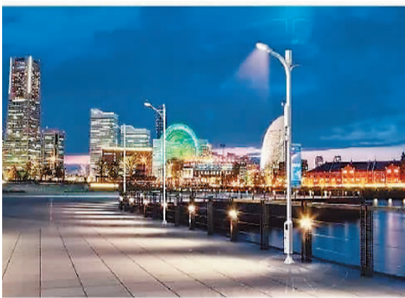
香港智慧路灯外观效果图

创科局和多个部门的联手试验规模更大，将在铜锣湾、中环、尖沙咀等区域设置400至500盏智慧