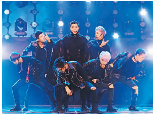
▲《偶像练习生》节目现场

《偶像练习生》日前在爱奇艺播出，节目从国内外各大经纪公司、练习生公司推荐的100名练习生当中，最终票选出优胜9人组成全新偶像男团。（文 综）