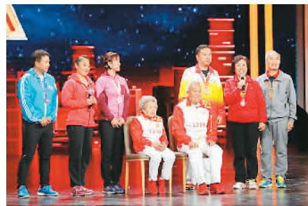
▲二位坐者为马拉松夫妇

根据相关规划，到2020年，海外中国文化中心将达到50个，它们将在民间色彩的文化交流中进行日常外交，让各国人民与中国相知、相亲，让走出国门的中国人看到更多真诚的微笑。