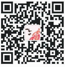
▲欢迎关注《人民日报海外版》文艺部微信公号“文艺菜园”

2017年底，美国收费视频网站Netflix（网飞）宣布购买中国自制网剧《白夜追凶》海外放映权，让这部剧集再度受到业内外高度关注。作为中国首部“出海”的国产网剧，《白夜追凶》将在全球190多个国家和地区播出。