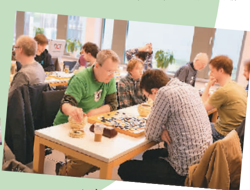
▲外国棋手在围棋大赛对弈 柏林中心王 娟摄

欢迎的项目外，还通过讲座、座谈、研讨会等形式进行思想对话。此外，中心根据当地需求设置语言、书画、舞蹈、武术等中国文化培训课程，还与当地文化、艺术、学术等机构共同举办文化活动，互为平台，交流互鉴。