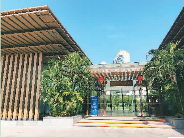
▲曼谷中心外观