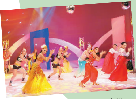
▲毛里求斯中心舞蹈队表演