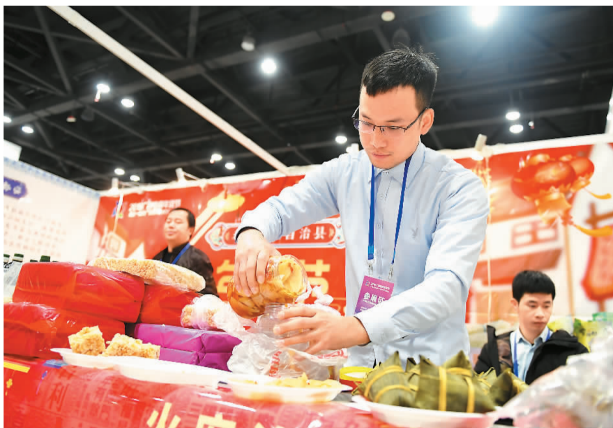
广西电商年货节日前在南京举行。图为一名参展商准备将产品给顾客品尝。

同时，除了“零关税”商品，其他一大批商品的关税也大幅降低，也使得消费者可以用更低廉的价格购买到这些产品。比如，今年1月初，中澳两国根据中国—澳大利亚自由贸易协定实施第四次降税，澳大利亚进口葡萄酒降低2.8%的关税，这也刺激了进口葡萄酒加大年货促销的力度。