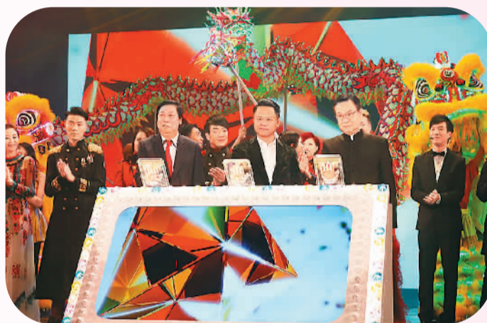
亚视复活启动仪式现场。（资料照片）

香港亚洲电视台在上世纪80年代推出的《大侠霍元甲》《精武门》《纵横四海》等电视剧，成为港澳台和内地众多观众心中的经典记忆。