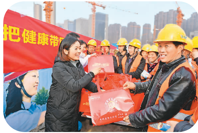
春节临近，安徽省合肥市方兴社区组织医务人员和卫计工作人员来到辖区建筑工地，为辛劳一年的农民工兄弟免费体检并送上“健康大礼包”。