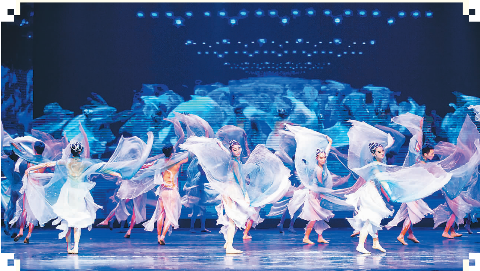
由中国国家艺术基金资助的舞剧《遇见大运河》近日在希腊雅典寰宇文化中心剧场上演。该剧由崔巍任总导演、杭州歌剧舞剧院排演。这是该剧全球巡演的第131场。全剧以“运河之水”为主线，讲述了中华文化在新时代的“如水之德”、构建人类命运共同体的宏伟倡议。图为演出场景。