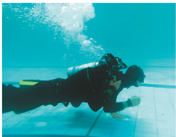
连日来，武警重庆总队船艇支队开展水中搏击、武装泅渡、水下射击等实战化训练，确保部队有效应对和处置各种突发事件。图为“蛙人”在进行水下结伴呼吸训练。