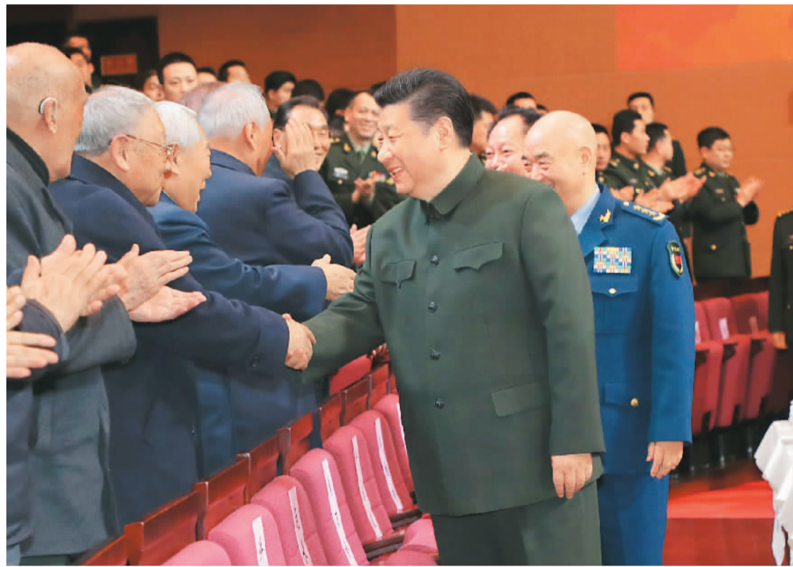
2月2日, 中央军委慰问驻京部队老干部迎新春文艺演出在北京举行。中共中央总书记、国家主席、中央军委主席习近平, 向在座的军队老同志, 向全军离退休老干部, 致以节日问候和新春祝福。

“中国新时代, 跟着你初心不改; 中国新时代, 跟着你开创未来……” 演出在交响乐与合唱《奋进新时代》激昂的旋律中拉开序幕。《强军步伐》《红色血脉》《壮丽航程》3个乐章贯穿传承红色基因、担当强军重任的思想内涵, 尽展形式多样、生动活泼的文艺轻骑风采。舞蹈《春风满军营》《练练练》, 男声组合《王杰的枪我们扛》《七十五厘米》, 表演唱《誓死出击·我要胜利》等节目, 辅展出一幅幅矢志强军、备战打仗的精武画卷, 彰显了新时代革命军人苦练精兵、敢打必胜的战斗风貌。全新编排的《南湖的船党的摇篮》《南泥湾》《打靶归来》《在希望的田野上》等经典歌曲, 唤起人们对激情岁月的美好回忆, 引起强烈共鸣。“前进向前进, 跟着必胜的信仰; 前进向前进, 实现复兴的伟大梦想……” 领唱与合唱《光荣与梦想》《不忘初心》《一起出发》《未来已来》等歌曲, 气势恢宏、催人奋进, 抒发了建设世界一流军队、实现中华民族伟大复兴中国梦的壮志豪情。演出在大合唱《三大纪律八项注意》中结束, 表达了人民军队坚定维护核心、坚决听从指挥的如磐信念。