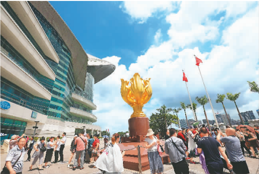
游客在香港金紫荆广场游览。

外部的政策支持也很重要。特区政府希望能在金融科技领域贡献一份助力，早早推出了金融科技的专用工作空间和专属培育计划，还建立了相关的监管沙盒。“香港已经创立了一个关于金融科技的智慧空间，我们希望到2020年之前培育出150家金融创新或者是金融技术的机构。我们已经推出了20亿港币的一个基金，以便能够对一些新兴的科技企业进行投资。”林郑月娥说。