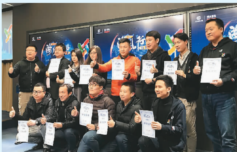
图为第2小组的海归学员在经营时的合影。

2018年1月16、17日，北京海外学人中心联合黑马学院举办第五期“海风行动成长营”。活动甄选出54家海归初创企业参与，还邀请了4位实战型创业导师、18位投资人，从创业认知、融资辅导、实战路演、政策扶持等方面帮助海归企业进入发展快车道。