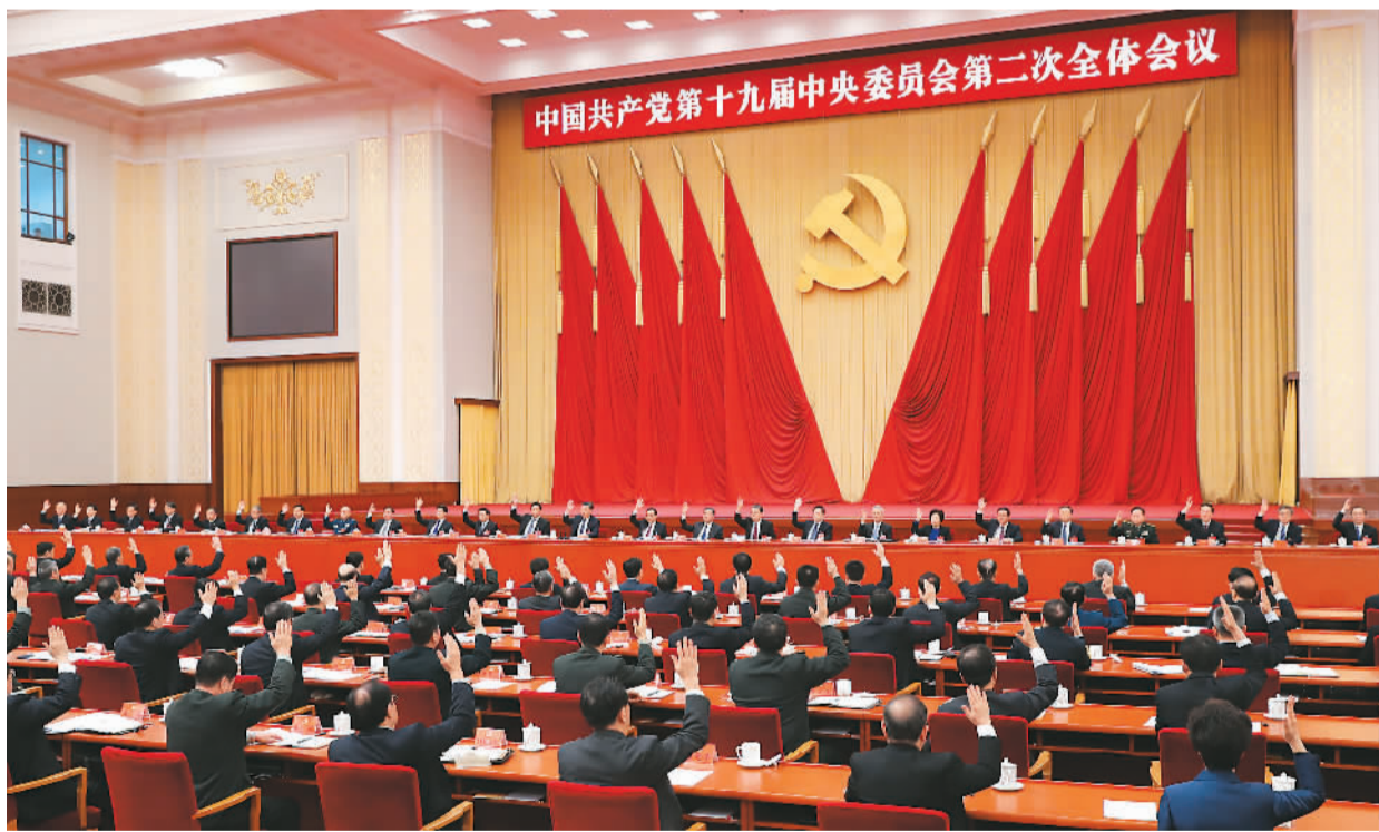
中国共产党第十九届中央委员会第二次全体会议，于2018年1月18日至19日在北京举行。中央政治局主持会议。新华社记者 庞兴雷摄

特色社会主义实践的发展而不断完善发展。这是我国宪法发展的一个显著特点，也是一条基本规律。从1954年我国第一部宪法诞生至今，我国宪法一直处在探索实践和不断完善过程中。1982年宪法公布施行后，根据我国改革开放和社会主义现代化建设的实践和发展，分别于1988年、1993年、1999年、2004年进行了4次修改。实践证明，我国宪法是同党团结带领人民进行的实践探索紧密联系在一起，随着时代进步、党和人民事业发展而不断完善。