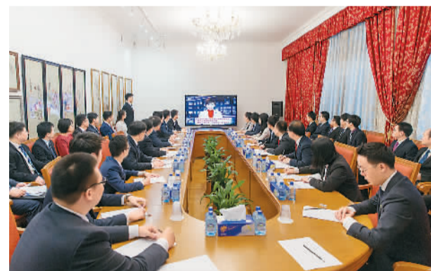
2017年12月30日，在俄罗斯首都莫斯科，中国留学生代表通过央视《新闻联播》聆听中共中央总书记、国家主席、中央军委主席习近平给莫斯科大学中国留学生的回信。